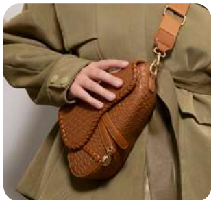
Aventura en caqui Moda