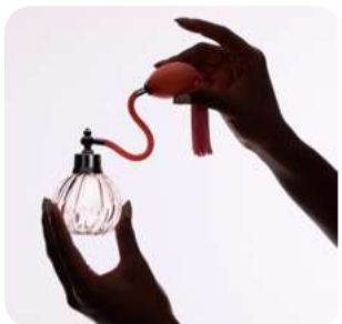
Aroma sobre aroma Belleza