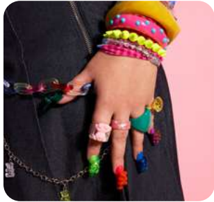
Gummymoda Comida, belleza