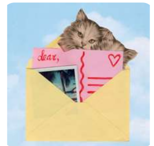
Amigos por correspondencia Pasatiempos, bienestar