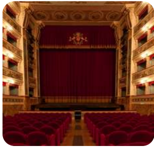
Fiesta en la ópera Celebraciones