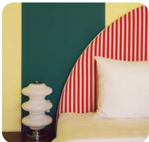
Vida circense Hogar