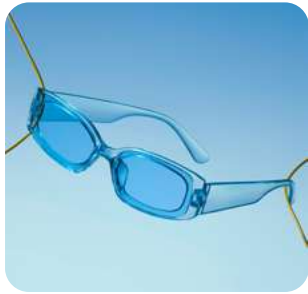
Azul bajo cero Bebidas, moda, belleza, celebraciones