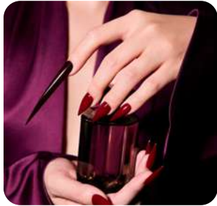
Gótico Romántico Belleza