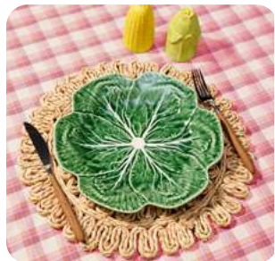
Revolución repollo Alimentos y bebidas