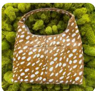
Delicadeza Salvaje Belleza, moda