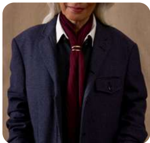
Pura poesía Pasatiempos, moda