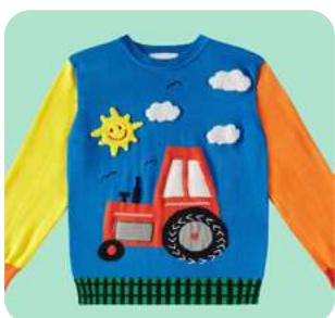
Retroniñez Crianza, moda