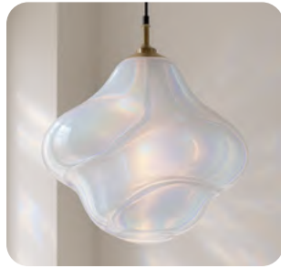
Extra Celestial Belleza, hogar, moda, automóviles