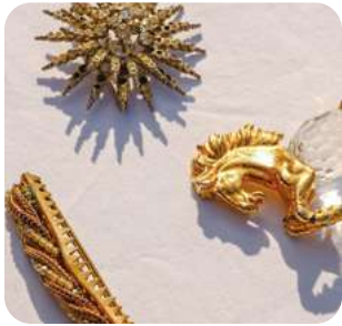
Broche de oro Moda