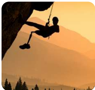
Destino adrenalina Viajes