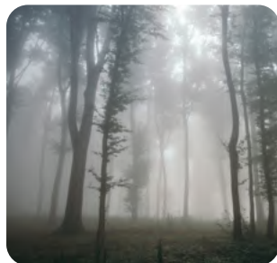
Destino místico Viajes