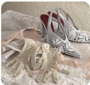
Encaje perfecto Moda, belleza