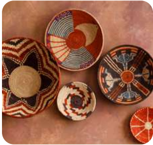
Estilo Afrobohemio Hogar